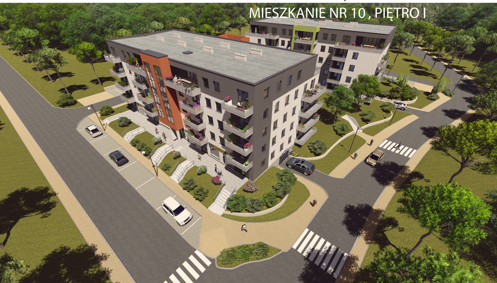
LOKALIZACJA MIESZKANIA W BUDYNGU