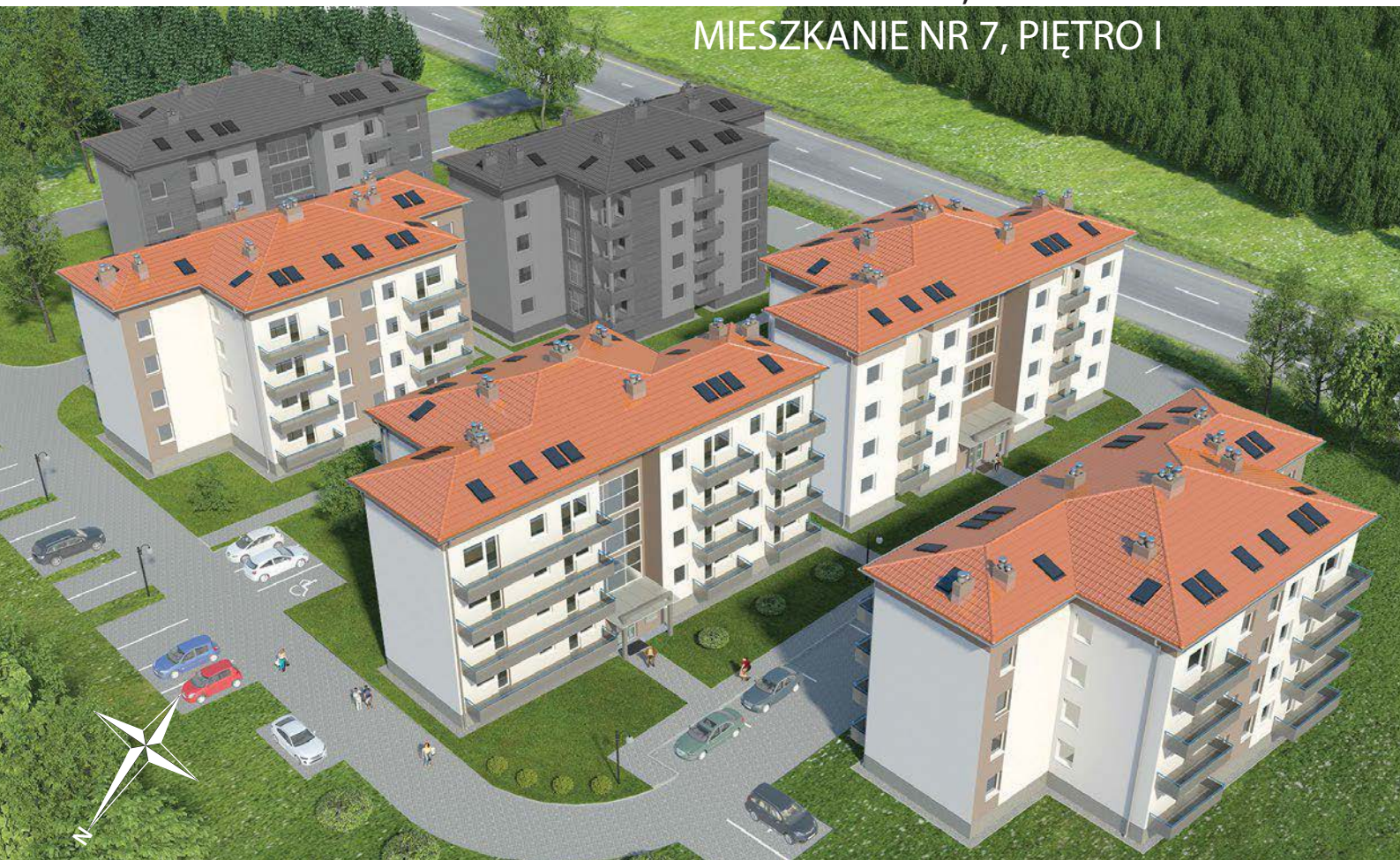
LOKALIZACJA MIESZKANIA W BUDYNKU

ZIELONA GÓRA, UL. AUGUSTOWSKA 11 MIESZKANIE NR 7, PIĘTRO I