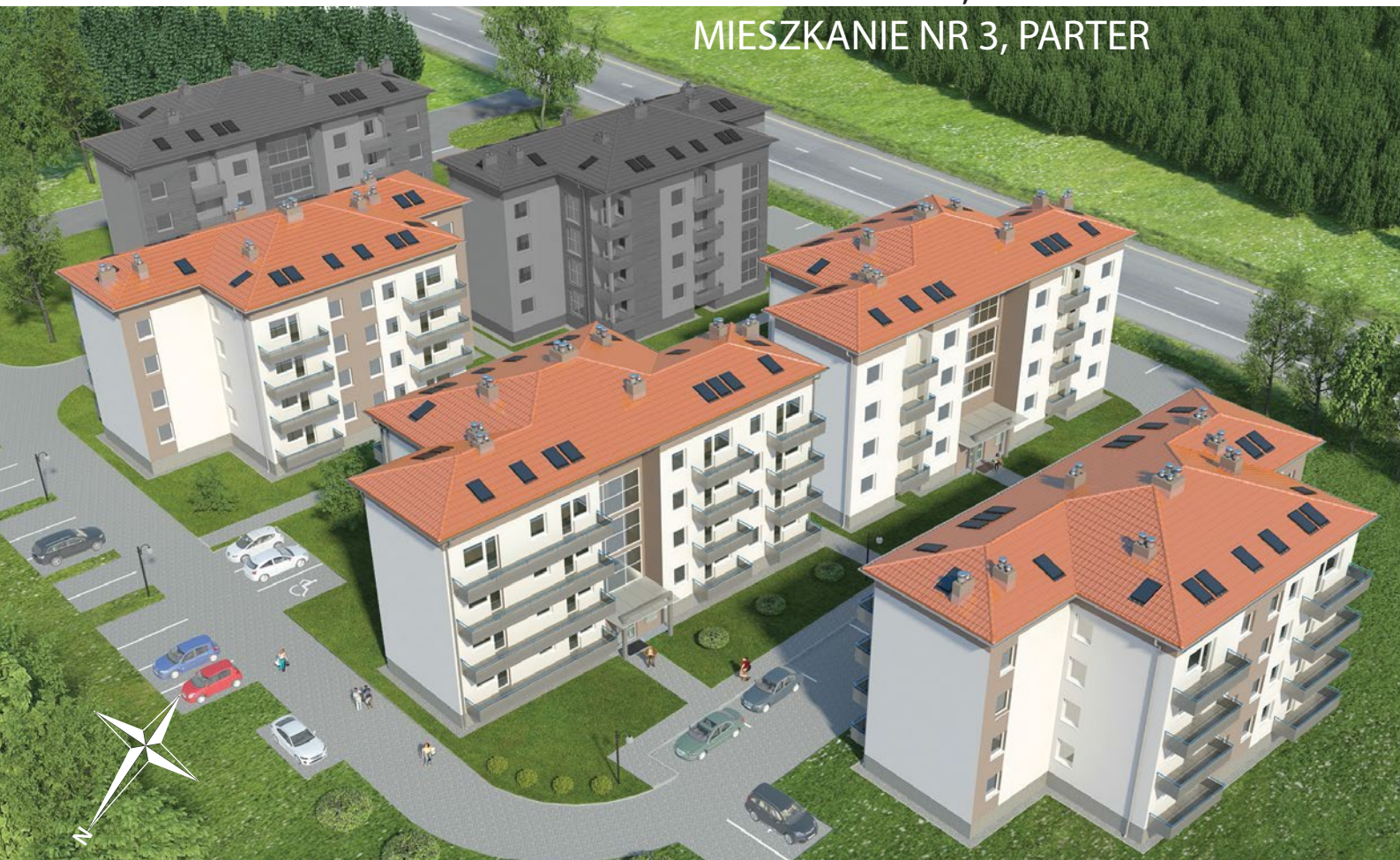
LOKALIZACJA MIESZKANIA W BUDYNKU

ZIELONA GÓRA, UL. AUGUSTOWSKA 7 MIESZKANIE NR 3, PARTER