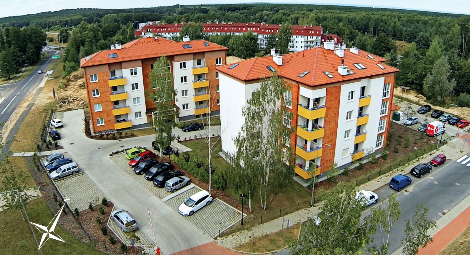
LOKALIZACJA MIESZKANIA W BUDYNKU

ZIELONA GÓRA, UL. AUGUSTOWSKA 5 MIESZKANIE NR 2, PARTER